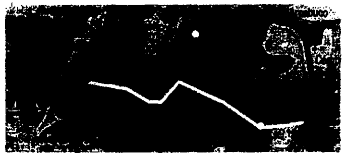
Mapa 1 Ubicación origen, destino y vía de las rutas.

Por ejemplo, a folio 45 para la ruta Chiquinquirá (Boyacá) - Tunja (Boyacá) y viceversa (vía Sáchica), para el periodo de las 05:00 a 05:59, se reporta un promedio de pasajeros de 19, siendo que al tomar la información base (ver tomo 2, folios: 115, 117 y 120), este promedio correspondería a 0 (ver tabla 1 y 5).